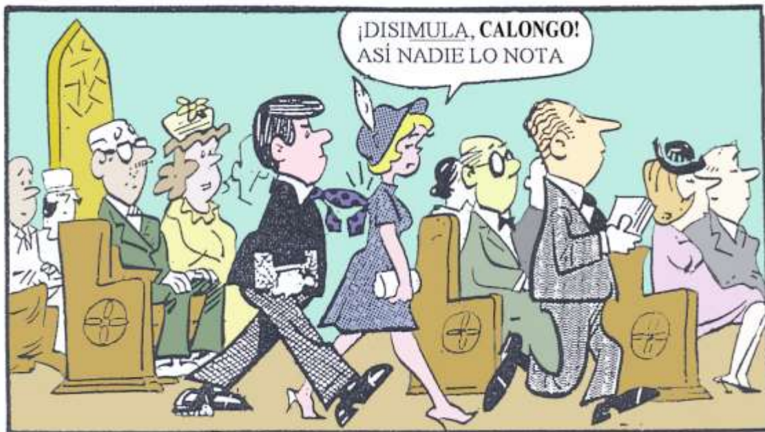
El Pastor Calongo y su linda ovejita